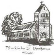
Pfarrkirche St. Bonifatius Hüven