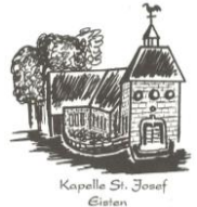
Kapelle St. Josef Eisten